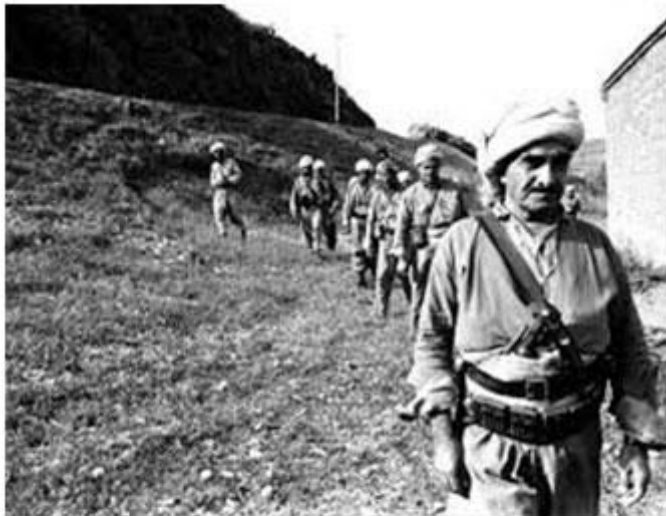
Molla Mustafa Barzani