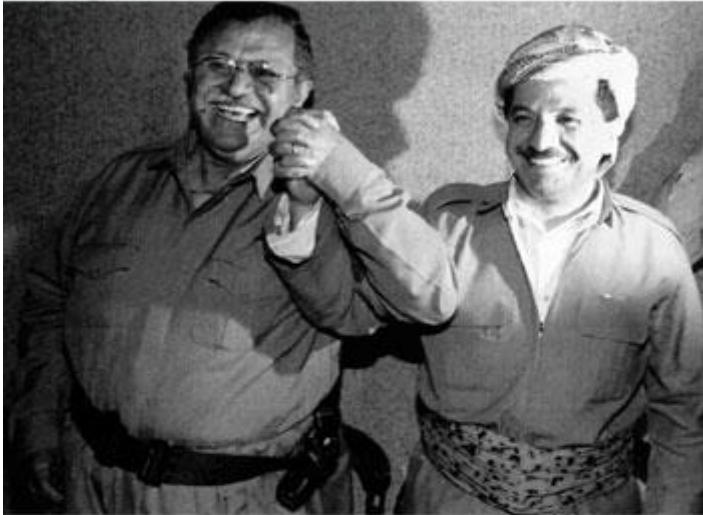
Celal Talabani - Mesut Barzani