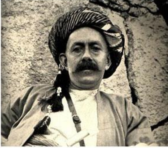
Şeyh Mahmut Berzenci