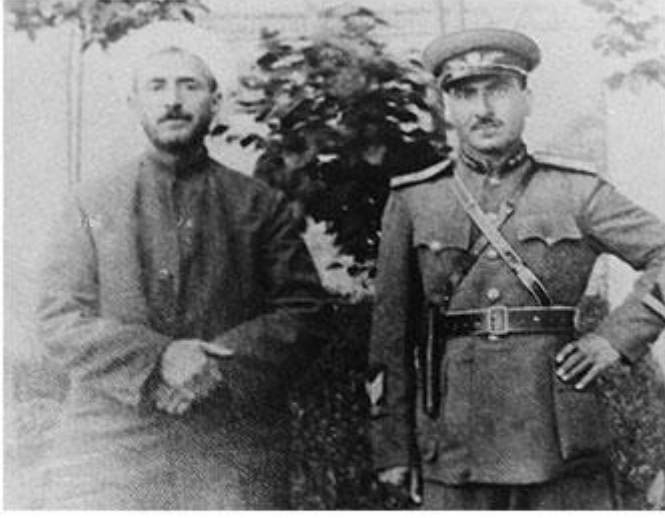
Molla Mustafa Barzani ( sađdaki )