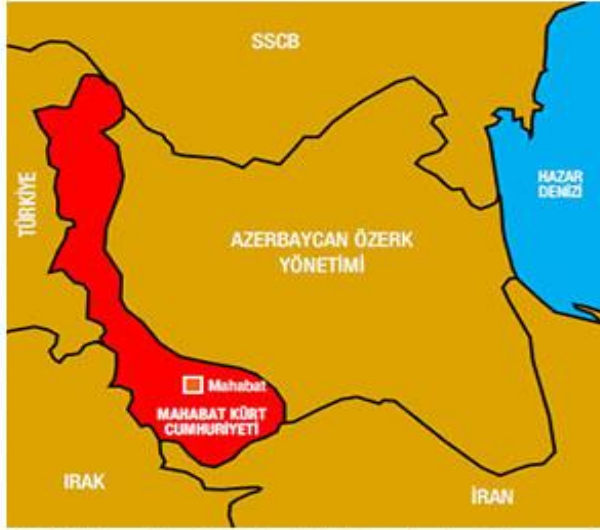
1946'da ilan edilen Mahabat Kürt Cumhuriyeti'nin sınırları