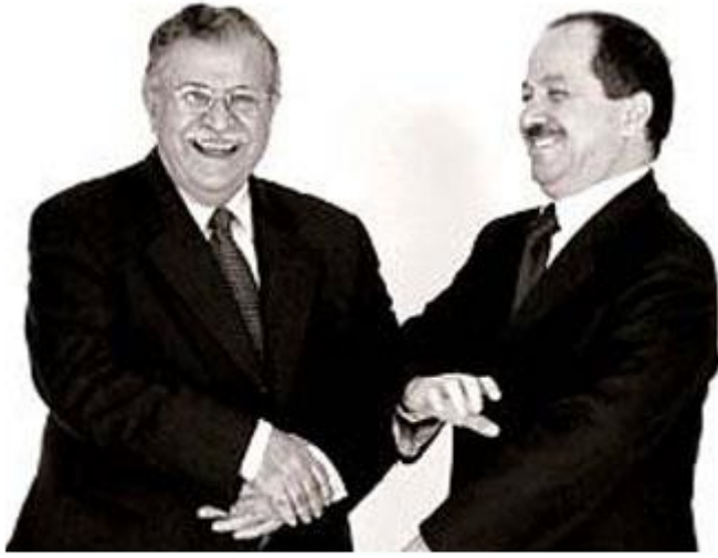
Celal Talabani - Mesut Barzani